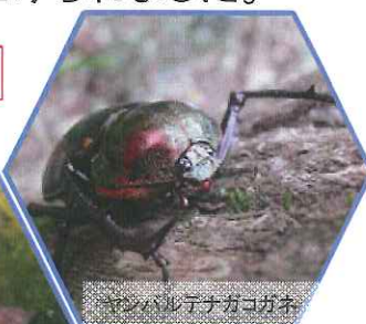
ヤシハルテナカコガネ