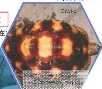
ホーリックガメ (通称ベガキリクガメ)