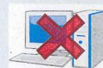
インターネットでの掲載