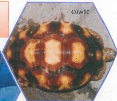
イニホーラクガメ (通称ヘサキリクガメ)