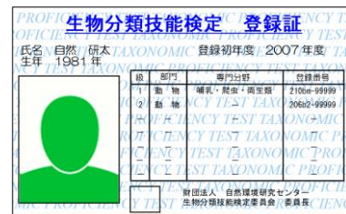
携帯型登録証の例